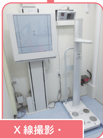
X線撮影・ 身体計測エリア