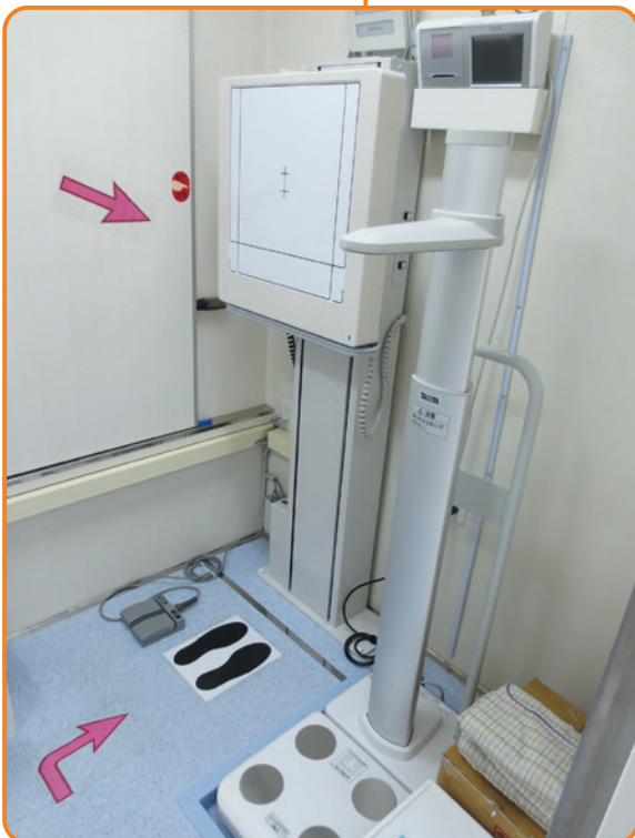
← 中央入口より左側が胸部X線検査および自動身長計付き体組成計検査エリア