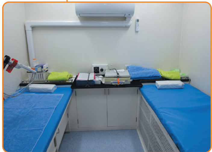
↑ 中央入口より右側が心電図検査エリア