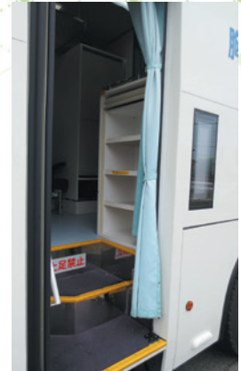
↑ LED案内表示板・受診者用下駄箱