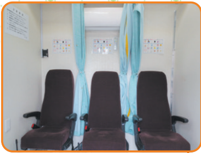
↑ 待ち合い用独立型シート